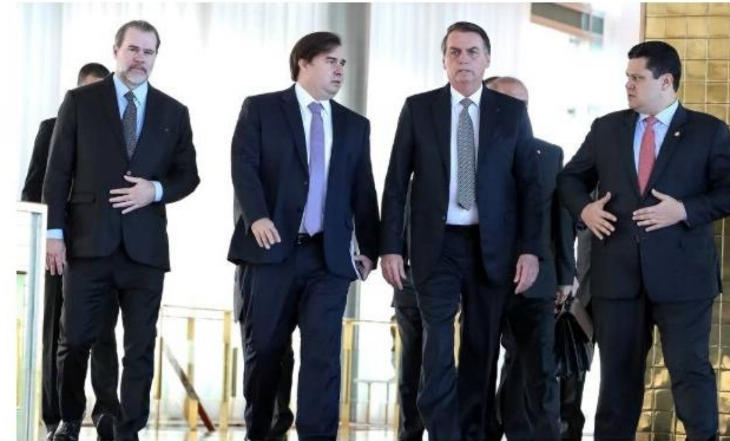
Bolsonaro recebe Dias Toffoli, Rodrigo Maia e Davi Alcolumbre no Palácio da Alvorada